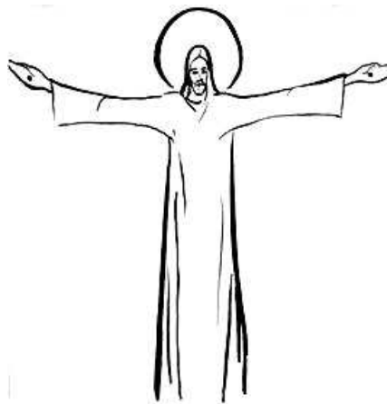
Komáromi J.: Széttárt karú Jézus.

A hit átadásának kiváltságos eszközei a szentségek. A pápa szól a keresztségről, az Eucharisziáról, a szentmisében elhangzó hitvallásról és a Miatyánkról, a parancsolatokról, az Egyház egységét megvalósító hit egységéről. Aki kikezdi a hitet, a szeretetegység (kommunió) igazságát csorbítja meg.