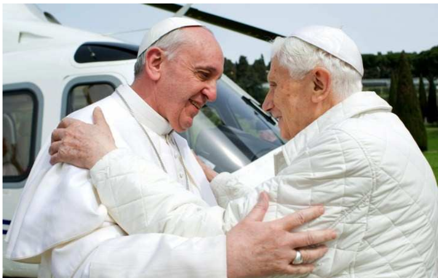
Ferenc pápa és XVI. Benedek emeritus pápa

A Lumen fidei kezdetű enciklika négy részre oszlik, egy bevezetéssel és egy végkövetkeztetéssel. Maga Ferenc pápa megmagyarázza, hogy XVI. Benedek a szeretetről és a reményről szóló enciklikái után majdnem befejezte a harmadikat is, ezt a hitről szóló körlevelét, melyhez ő további kiegészítéseket fűzött.