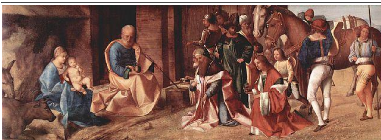
Giorgione da Castelfranco: Jászlánál három királyok imádják Krisztust

Erről a jászlánál töltött éjszakáról Celanói Tamás az első életrajzban beszél az olvasó számára meghatározó módon, amivel ugyanakkor döntően hozzájárult ahhoz, hogy a legszebb karácsonyi szokás - a jászol megjelenítése - kialakulhasson. Ezért joggal mondhatjuk, hogy a greccói éjszaka a karácsony ünnepét egészen új ajándékként adta a kereszténységnek. Ezáltal annak sajátos üzenete, különös bensősége és emberisége Istenünk emberszeretetét közölte a lelkekkel és a hitnek új dimenziót adott.