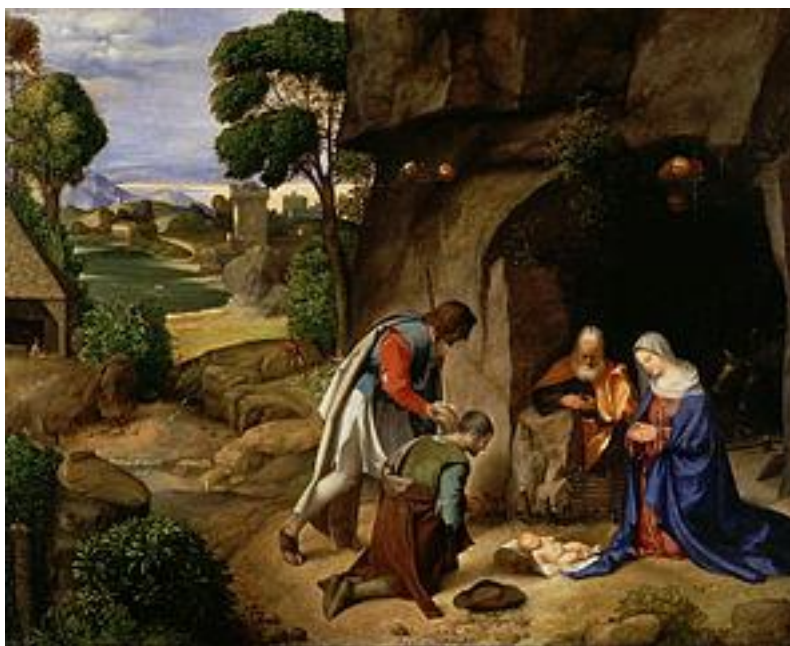
Giorgione da Castelfranco: Szent Családnál a Pásztorok hódolnak

A Ferences Világi Rend képzési levele. Megjelenik kéthavonta. "Ingyen kaptátok, ingyen adjátok." Kiadja a FVR Országos Tanácsa belső használatra. 1024 Budapest, Rómer Flóris u. 4.